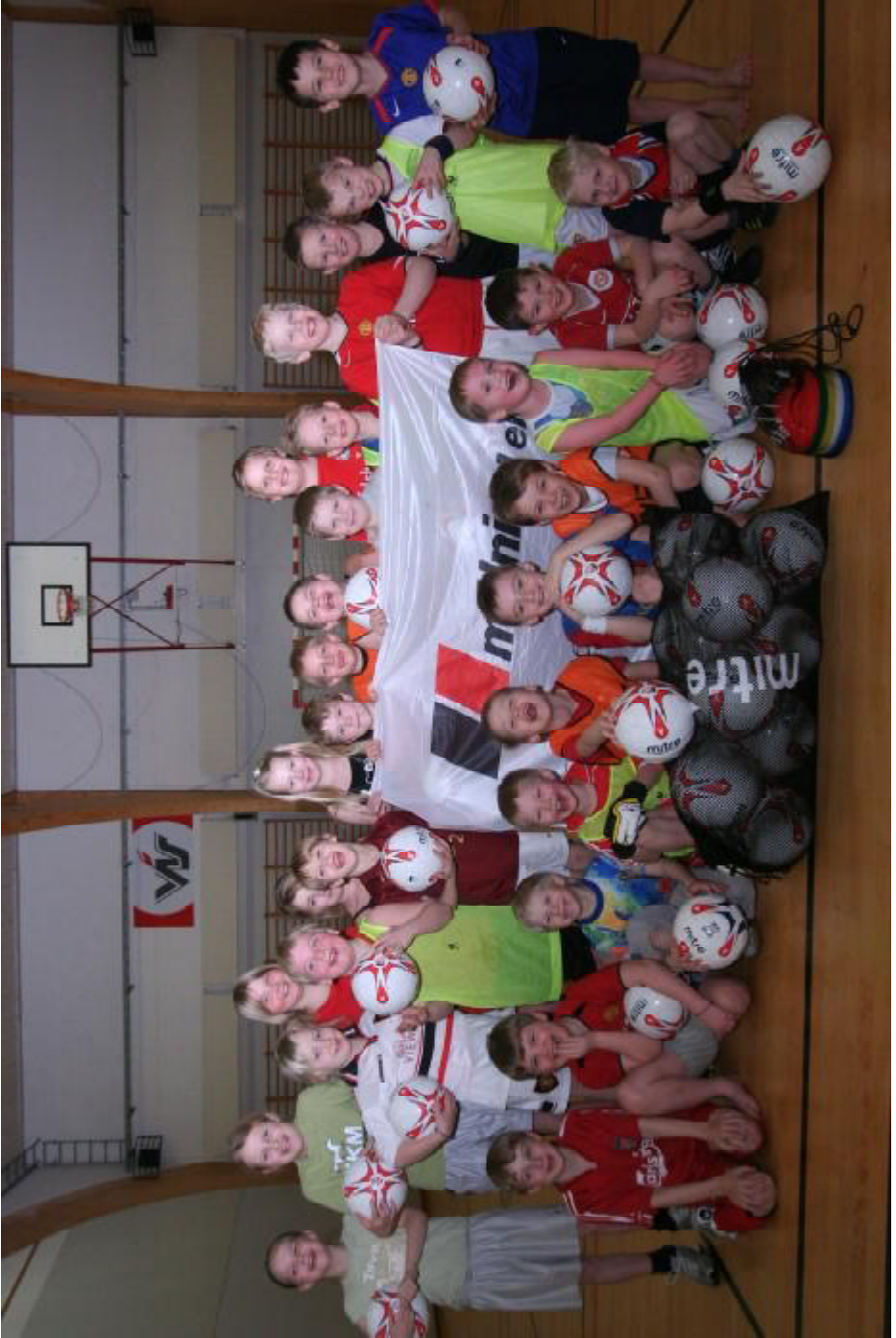
Glaðbeittir krakkar taka á móti fótboltagjöf frá Málningu