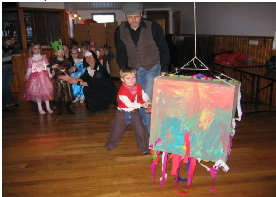
Frá öskudagsskemmtun Leikskólans Myndin fylgdi greininni frá Leikskólanum