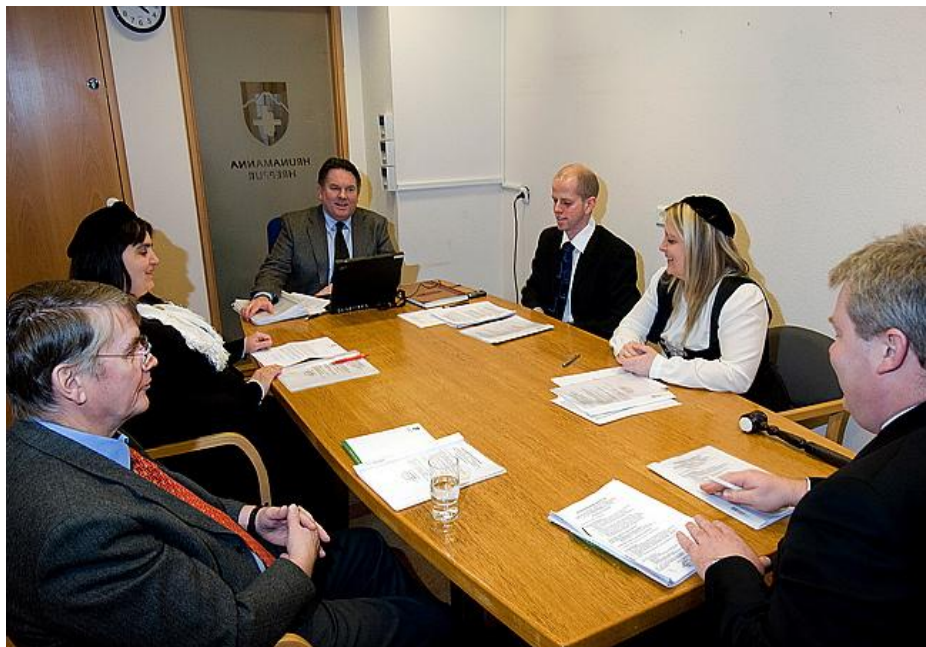
Sveitarstjórn að störfum