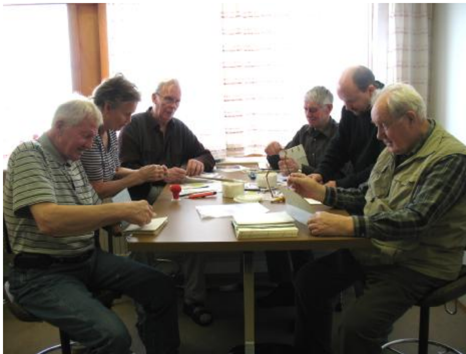
Unnið við bókbænd í Heimalandi