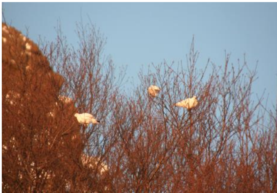
Rjúpur í trjátoppum í Dalbæ