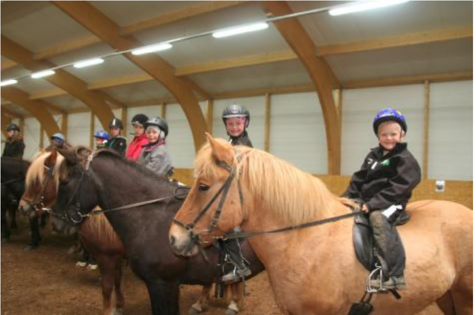
Knapar framtíðarinnar.