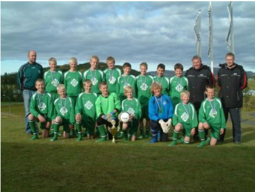
Íslandmeistarar í 4 flokki karla ásamt hiálfurum