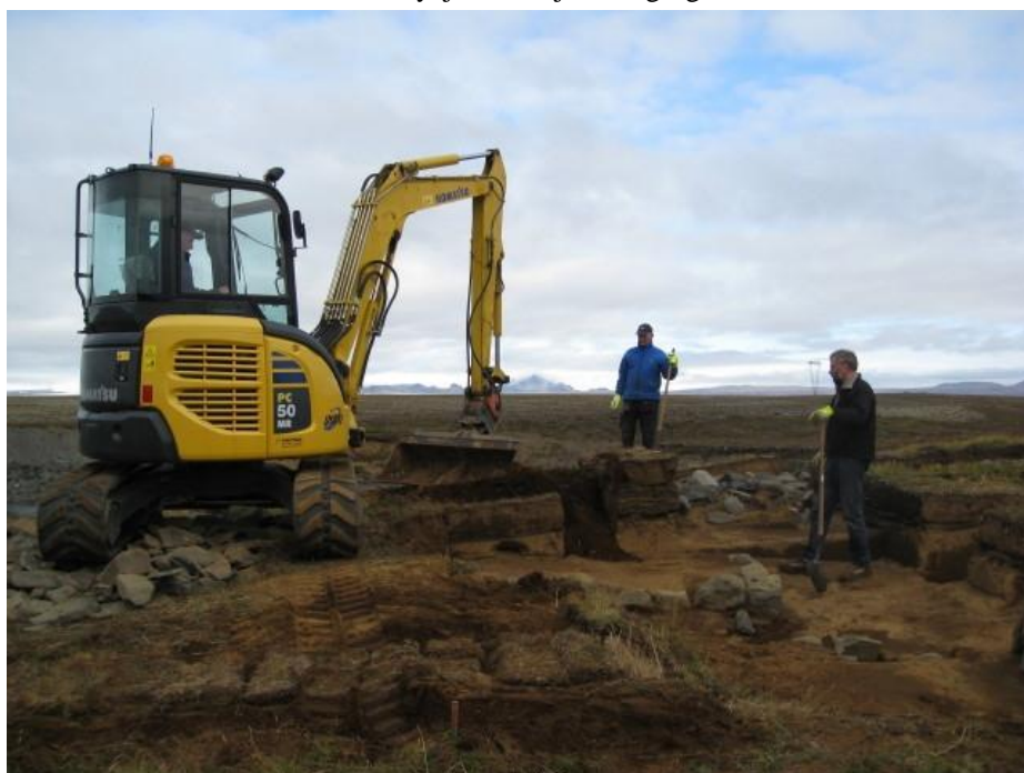
Genoið frá eftir fornleifaunnorróft á Rúðararhalka