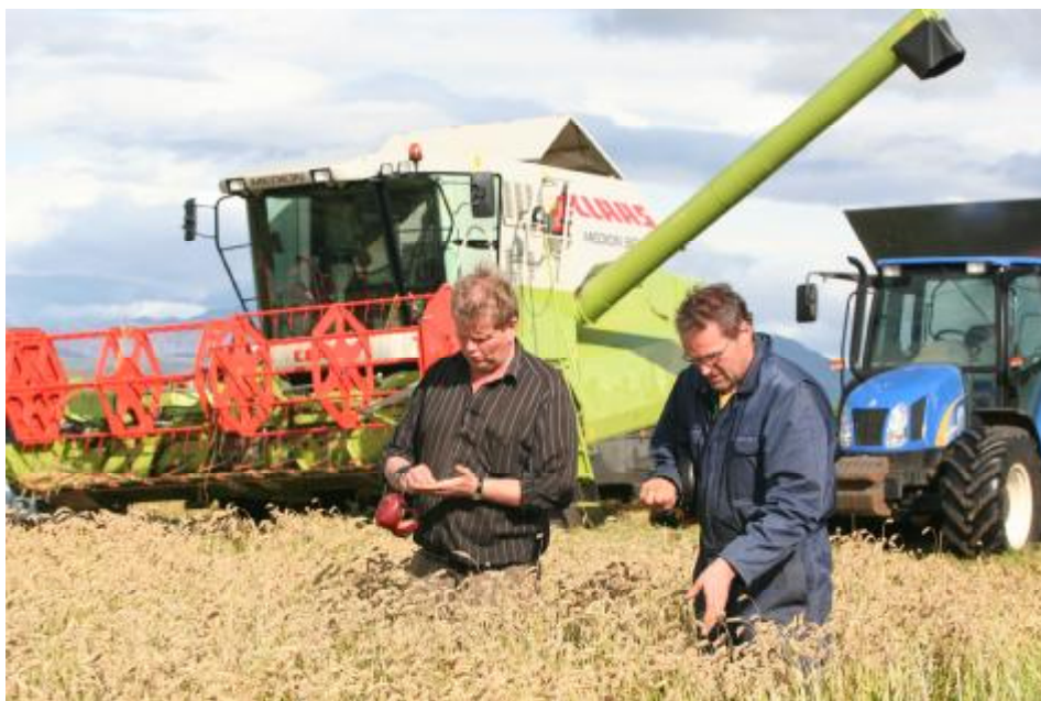
Kornskurður í Bryðjuholti.