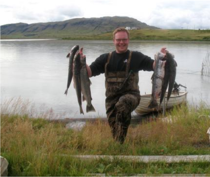
Ingibjörn í Auðsholti með góðan afla.