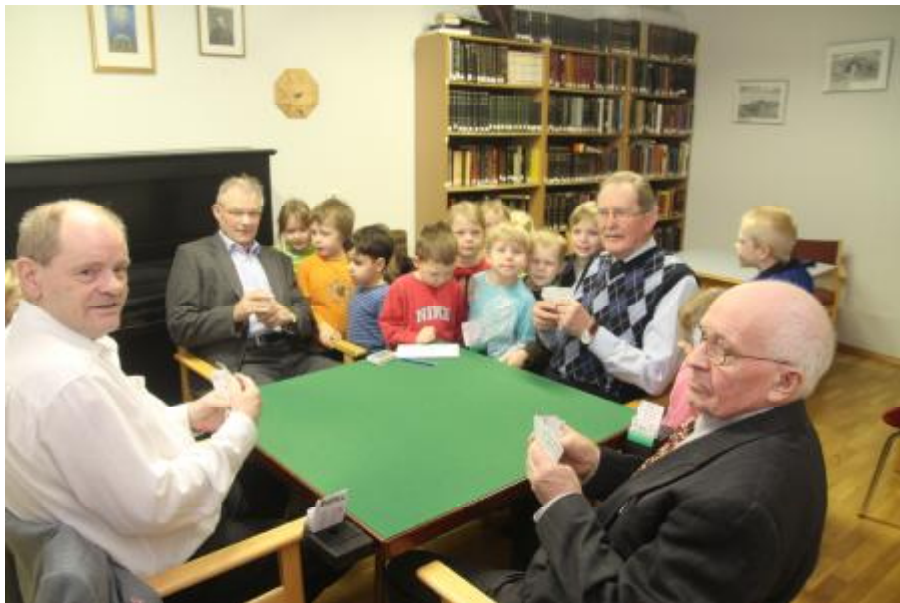
Leikskólabörn í heimsókn í Heimalandi