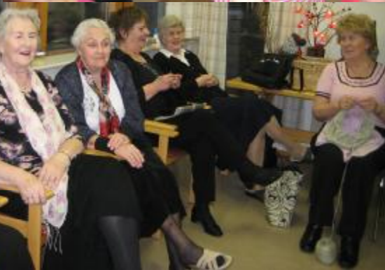
Myndir frá heimsókn í Heimaland og "jólaveinaheimsókn"