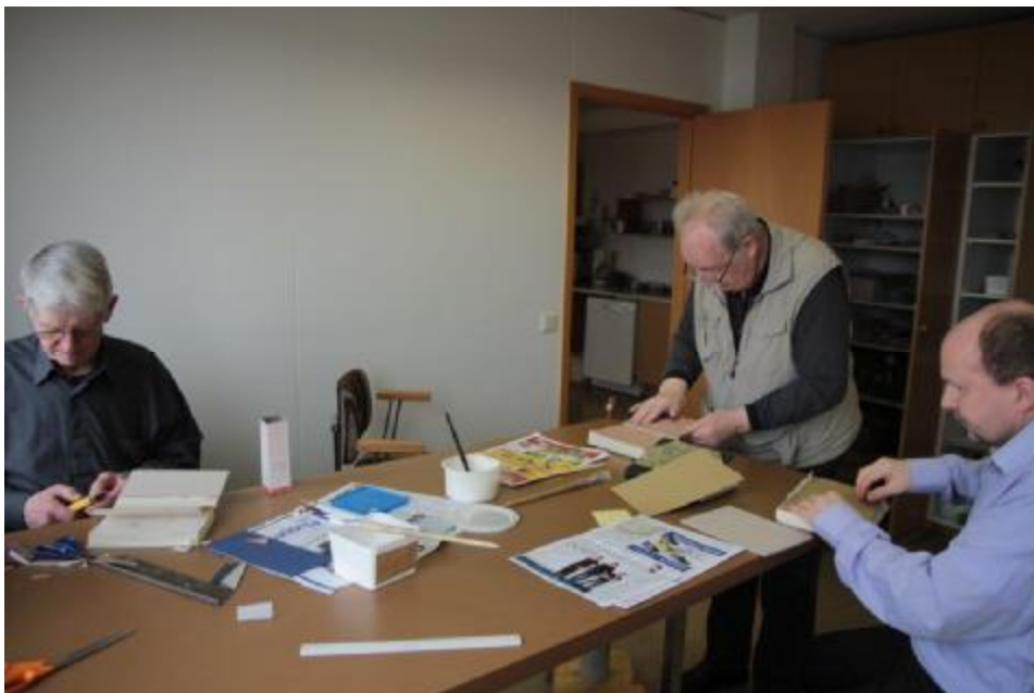
Eldri borgarar að störfum í Heimalandi