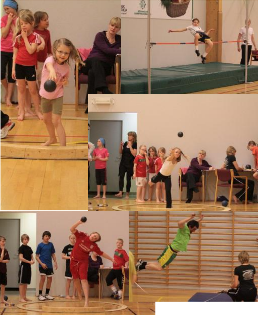
Nokkrar myndir frá páskamótinu þann 23. apríl sl.