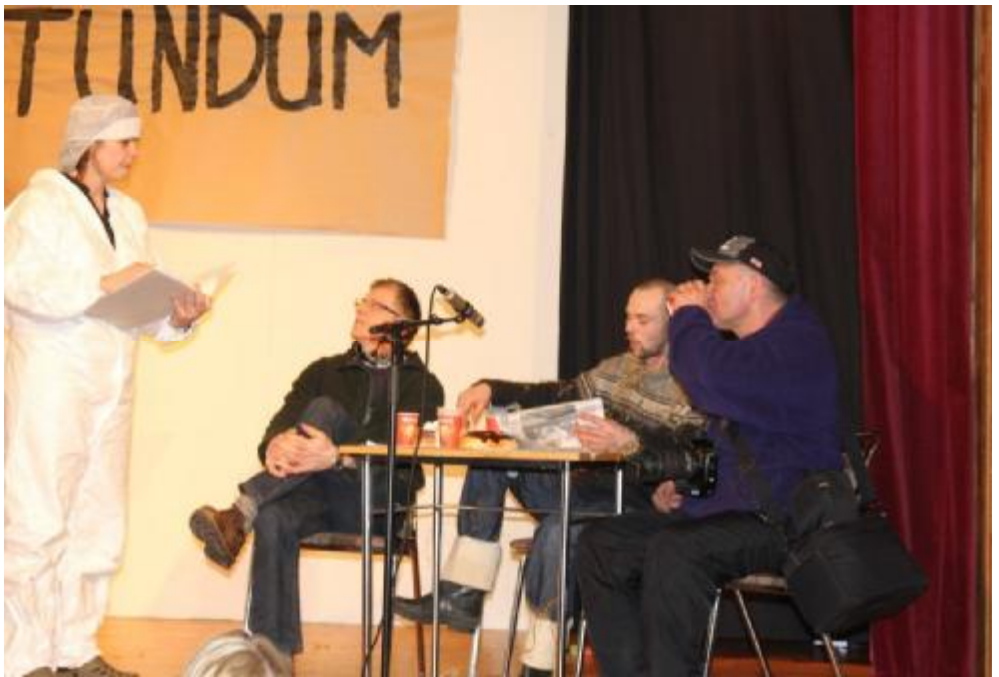
Þann 3.mars sl. Var Hjónaballið haldið í 69. sinn Sem endranær var margt um manninn og frá Hjónaballsnefndinni kom úrval skemmtiatriða, sem kitluðu hláturtaugarnar