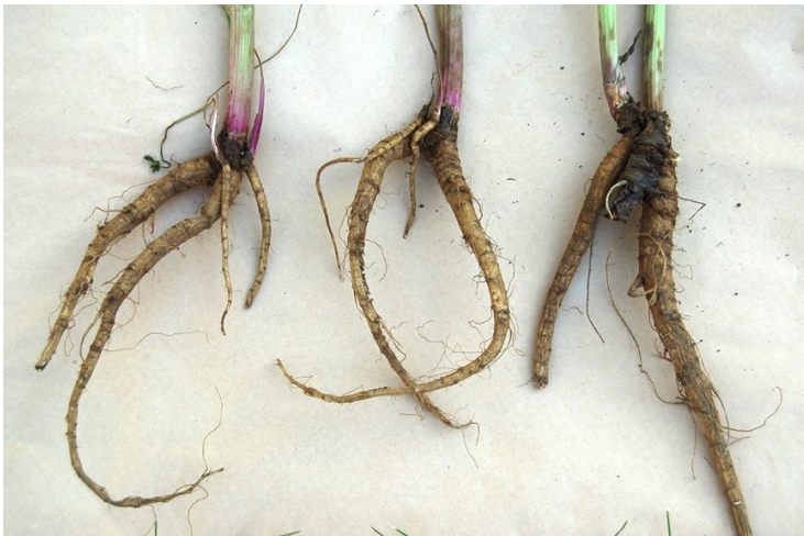
2. mynd. Rætur skógarkerfils. Til vinstri og í miðju sjást „rótARBÖRN“ á rótum fullvaxinna plantna. Til hægri er dauð rót af gamalli móðurplöntu. Utan á henni eru „rótARBÖRN“ sem eru komin vel á legg. Ljós. SHM 26. júní 2007

Skógarkerfillinn fjölgar sér bæði með fræi og með rötarskotum sem kalla mætti „rótARBÖRN“ (2. mynd). Kerfillinn blómstrar yfirleitt um miðjan júní og standa blómin fremur stutt. Blómgun er háð stærð plöntunnar en kerfillinn blómstrar yfirleitt á þriðja til fjórða ári. Hann þroskar fræ í lok ágúst og í september og getur hver planta myndað allt að 10.000 fræ. Fræ kerfilsins eru venjulega fremur skammlíf og lifa flest aðeins einn vetur. Fræin þurfa að vera í kulda til þess að spíra en þau spíra snemma vors. Fyrsta sumarið myndar plantan blaðhvirfingu og öflugna stólparót. Næstu sumur stækkar plantan og blómstar þegar hún hefur náð nægilegri stærð. Jafnframt myndast tvö „rótARBÖRN“ utan á meginrótinni (2. mynd). Að lokinni blómgun og frædreifingu deyr plantan en „rótARBÖRNIN“ losna þá frá hinni deyjandi móður og taka að vaxa. Skógarkerfillinn fjölgar sér því bæði með fræi og vaxtaræxlun. Þetta er afar mikilvægur eiginleiki sem gerir það að verkum að víða er mjög erfitt að uppræta hann þar sem hann hefur komið sér fyrir.