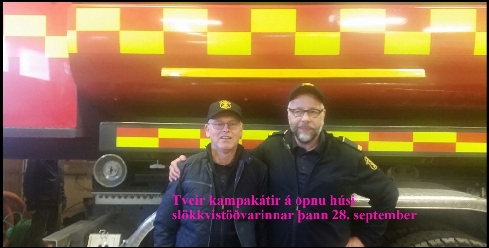
Tveir kampakátir á opnu húsi slökkvistöðvarinnar þann 28. september