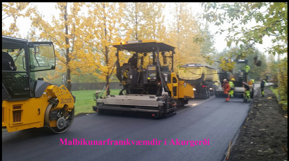
Malbikunarframkvæmdir í Akurgerði