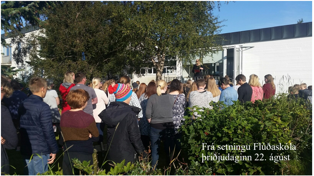
Frá setningu Flúðaskóla þriðjudaginn 22. ágúst