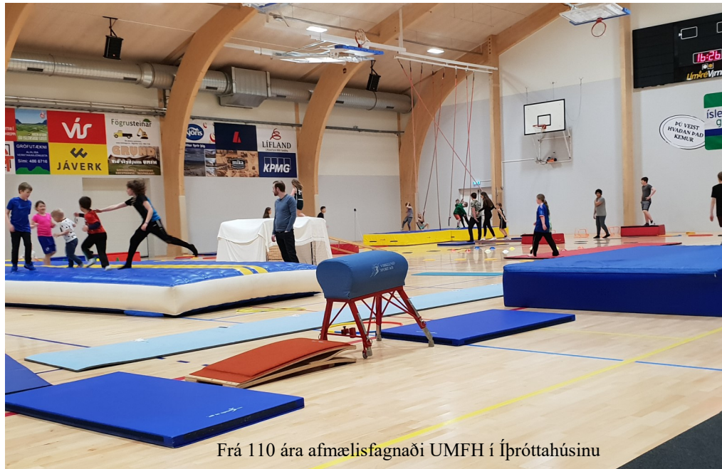
Frá 110 ára afmælisfagnaði UMFH í Íþróttahúsinu