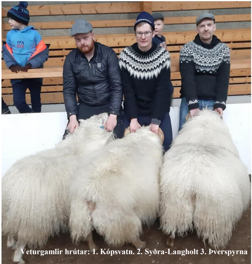
Veturgamlir hrútar: 1. Kópsvatn. 2. Syðra-Langholt 3. Þverspyrna