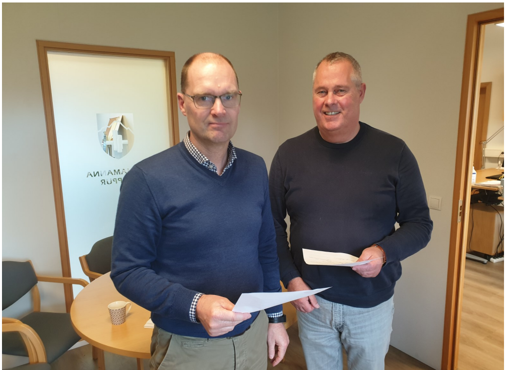
Frá undirskrift þjónustusamnings við Terru.