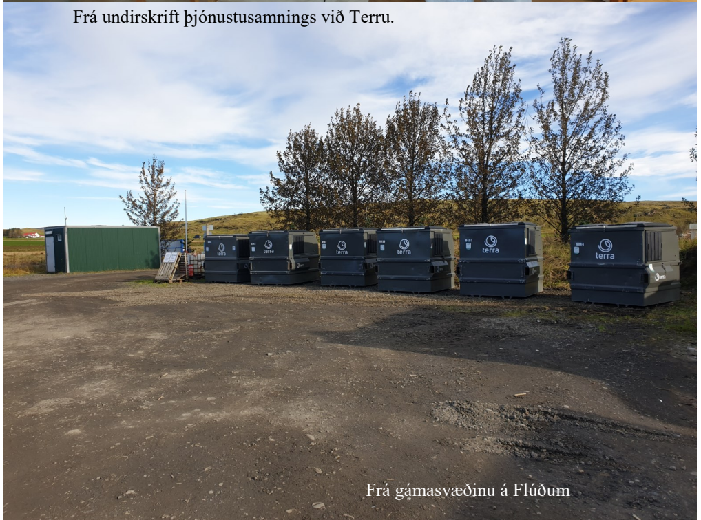
Frá gámasvæðinu á Flúðum